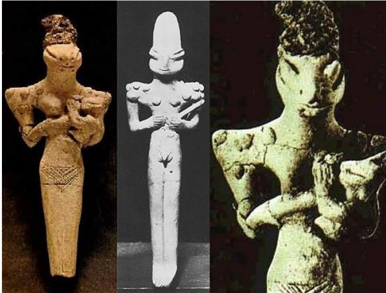
Estatuas de arcilla encontradas en Mesopotamia que datan de hace unos 5.000 años

Este, tanto por cómo estaba hecho como por la forma en la que actuaba, ya había sido colocado por mí en relación con el alienígena Reptiloide que aparecía en las reconstrucciones de los abducidos.