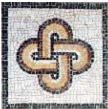
El nudo de Salomón

Así se expresa Marisa U. en su sitio: http://digilander.libero.it/Marisau/index.htm .