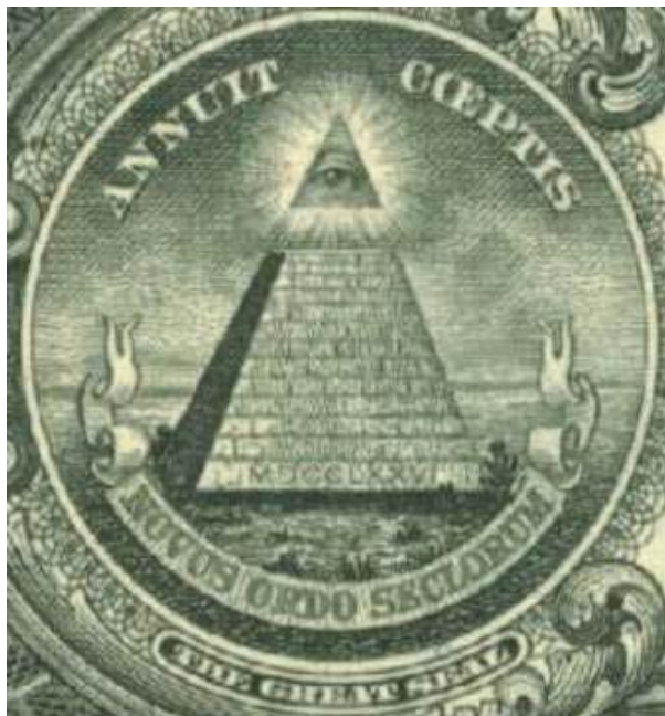
El ojo de Horus mirando a través del triángulo de la trinidad del poder.

Los Illuminati estarían muy activos, especialmente en América, donde también imprimirían sus símbolos secretos en los billetes.